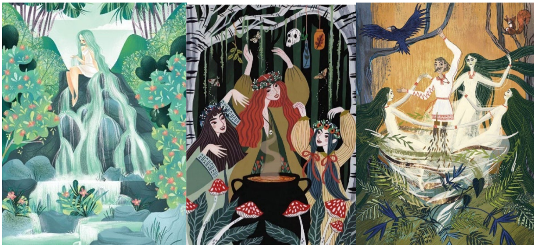
Рисунок 1 – Ілюстрації до казок з образами природи

Методика дослідження включає аналіз світового досвіду утворення та реалізації біофільних проєктів, встановлення факторів та можливостей адаптації цих рішень до українських умов.